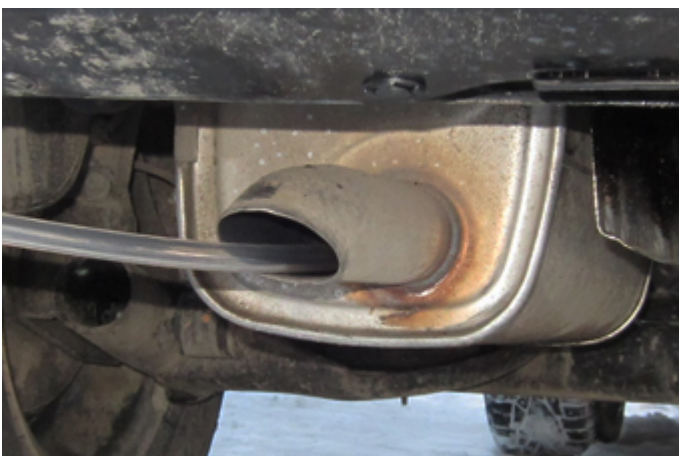
В системе выхлопа отработанных газов