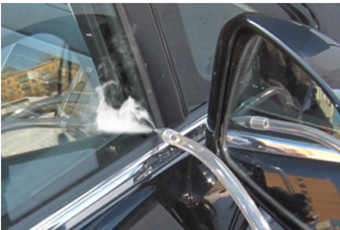
Через уплотнители стекол