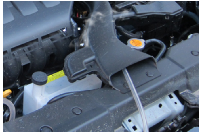
Во впускном коллекторе