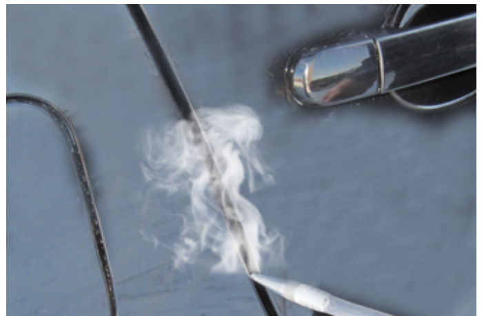
Через уплотнители дверей